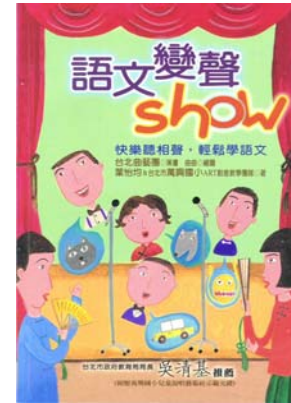
95-96 語文 變聲show