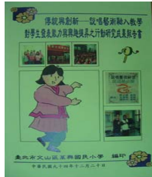
93-94 說唱藝術融入教學