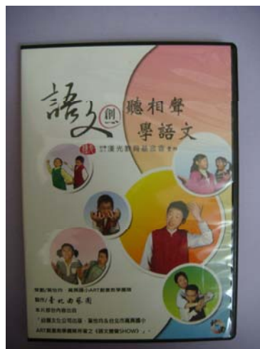
98 語文變聲 show DVD