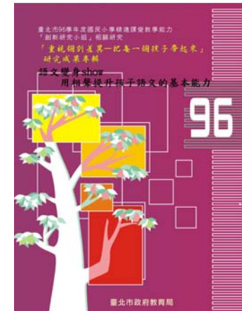
95-96 精進課堂教學能力