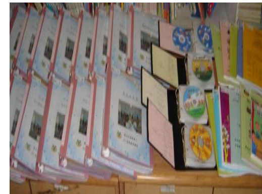
91-97 各類教學檔案、光碟